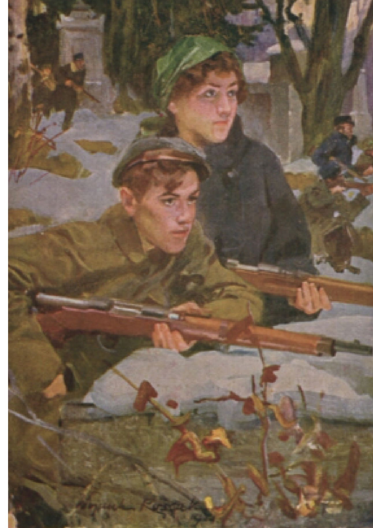
"Orlęta", Wojciech Kossak

Nie był to jednak koniec walk. Starcie nie przesądziło o losach ziem wschodnich. Niedługo później Ukraińcy po raz kolejny uderzyli na Lwów i walki trwały prawie do połowy 1919 r.