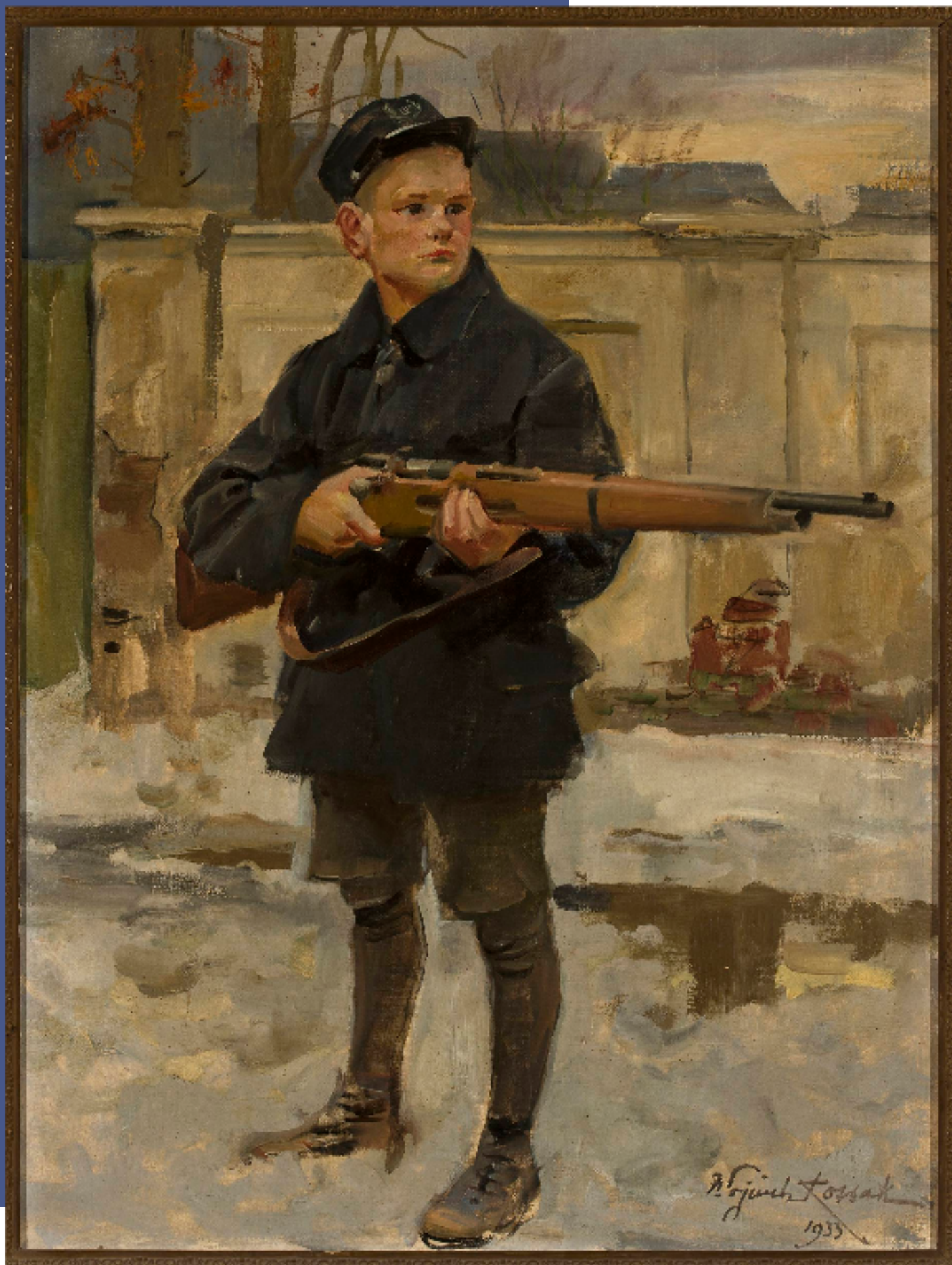
"Orlą lwowskie", Wojciech Kossak

W walkach o miasto udział wzięli także uczniowie i studenci. Młodych obrońców Lwowa określa się mianem Orląt Lwowskich.